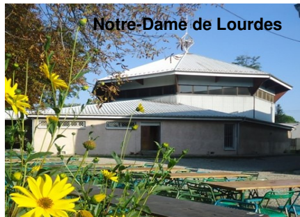
Notre-Dame de Lourdes