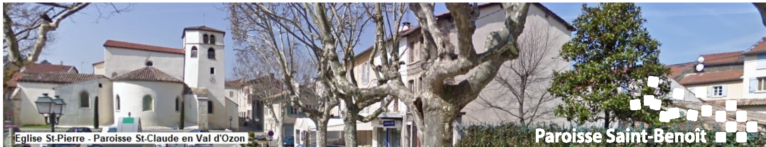
Eglise St-Pierre - Paroisse St-Claude en Val d'Ozon