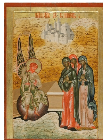
Icône russe du XVIIIe